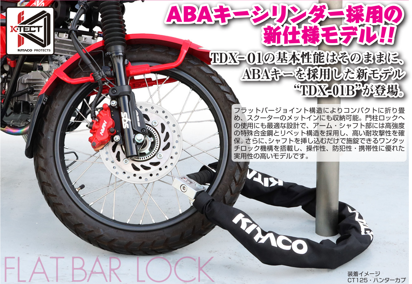
装着イメージ CT125・ハンターカブ

フラットバージョイント構造によりコンパクトに折り畳め、スクーターのメットインにも収納可能。門柱ロックへの使用にも最適な設計で、アーム・シャフト部には高強度の特殊合金鋼とリベット構造を採用し、高い耐攻撃性を確保。さらに、シャフトを挿し込むだけで施錠できるワンタッチロック機構を搭載し、操作性、防犯性・携帯性に優れた実用性の高いモデルです。