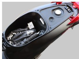
ディオ110 メットインにすっぽり

●TDX-01B はフラットバージョイント構造により、コンパクトで使いやすいロック。横一定方向への可動で脱着時に安定し、メットインに収納できるほどコンパクトに折り畳めます。