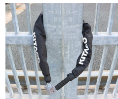
門柱ロックとして